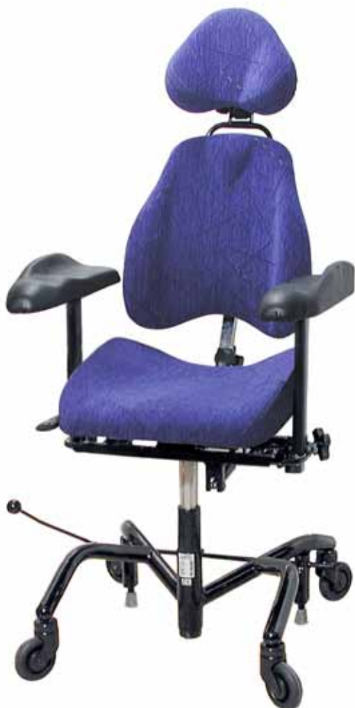
Real 9000 Plus

Kravet på sitsens egenskaper, som är grunden för att kunna skapa god ergonomi, är att den är stabil och bekväm. Det nya komfort-sittsystemet för Real 9000 Plus & 6100, ErgoMedic® Plus, har vad som krävs.