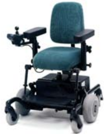
Anpassad för barn med Medic benstöd

REAL 6100 är provad och godkänd av Hjälpmedelsinstitutet (HI)