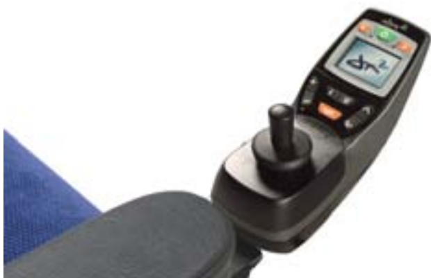
Manövrerenhet DX 2-REM 550

Från den översiktliga manövrerenheten styr man REAL 6100. De flesta funktioner styrs med en joystick. Manövrerenheten är monterad på en ledad arm och är lätt att flytta i sidled eller till valfri sida av stolen. Den nya manövrerenheten DX 2-REM 550 är förberedd