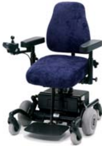
Elektrisk sits- och ryggvinkling