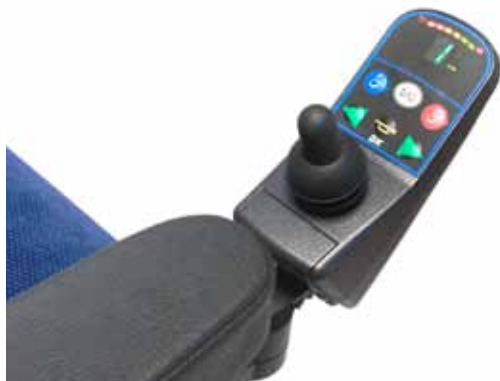
Ny manöverbox DX G90A