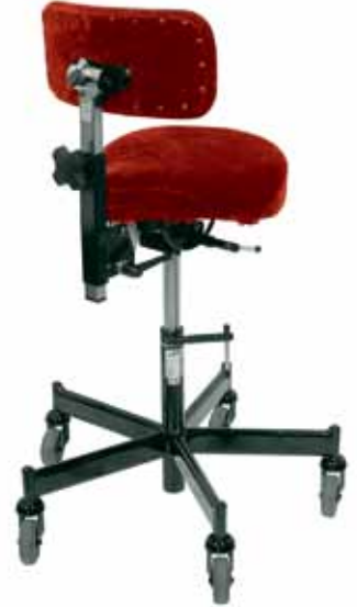
REAL 2625 Uitgerust met Zadelzit 36x36 cm. Alternatieve maagsteun 33x16 cm.