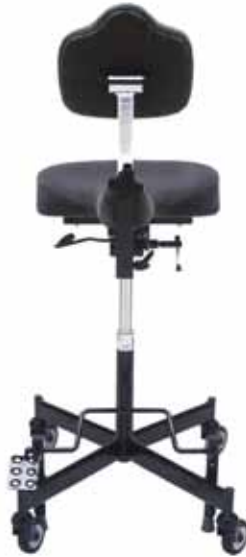
REAL 2624 Uitgerust met Zadelzitting Medic 40x36 cm. Maagsteun Medic 27x33 cm.