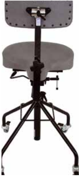
REAL 2621 Uitgerust met Zadelzitting Medic 40x36 cm. Alternatieve maagsteun 33x16 cm Extra uitrusting: Wielen 50 mm met rem.