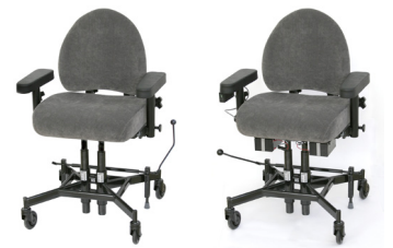
REAL 9200 REAL 9200 EL